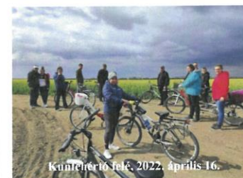
Kunféherő felé, 2022. április 16.