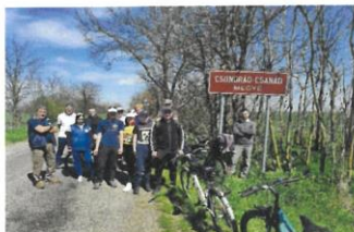
Békés és Csongrád-Csanád megye határán 2022. április 14-én

2011 óta több mint 130 túrát szerveztünk.