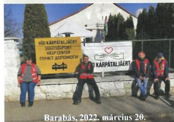
Barabás, 2022. március 20.

Minden egyesületi tagunk szeretetben gazdag karácsonyt és boldog új évet kívánunk!