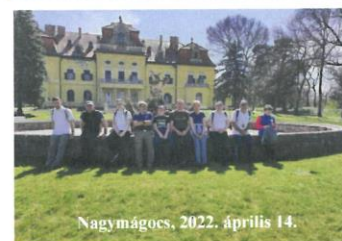
Nagymágyos, 2022. április 14.