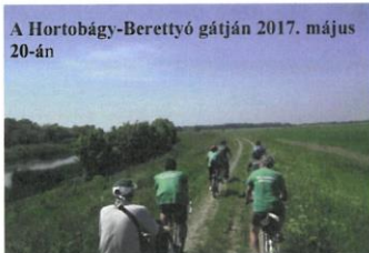
A Hortobágy-Berettyó gátján 2017. május 20-án